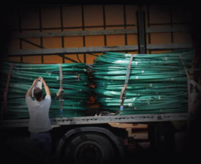
ניסוי שליפה מתוך הדיס

עוגן ה-CABLEX יתן פיתרון נוח לישום בכל המקומות בהם תעבור הרכבת הקלה ובמגרשי שכנים המחייבים סילוק העוגן בגמר שימוש. העוגן עשוי מכבלי FRP, גמיש, ולכן ניתן לעבוד איתו במקומות מוגבלים, מנהרות ומקומות צרים. עוגן ה-CABLEX מורכב מכלי FIREP בעובי 0.6 מחוברים למוט הברגה. ניתן לתכנן את העוגן לאורך הנדרש, העוגן נדרך כנגד קורה או קיר לעומס הנדרש, וננעל בעזרת אום על מוט ההברגה.